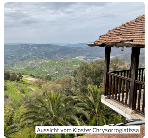
Aussicht vom Kloster Chrysorrogiatissa