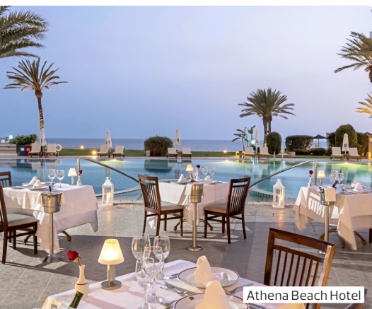
Athena Beach Hotel