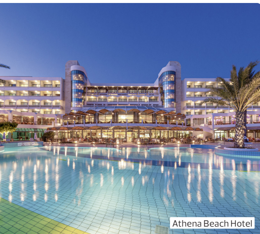
Athena Beach Hotel

Die Insel der Aphrodite ist ein Freilichtmuseum der Geschichte und ein Schatzhaus der Kunst: Faszinierende antike Stätten, wunderbar erhaltene byzantinische Fresken in Kirchen und Klöstern, Relikte aus der Zeit der Kreuzfahrer, der venezianischen, osmanischen und englischen Herrschaft. Alte Dörfer mit freundlichen, hilfsbereiten Menschen, eine schmackhafte Küche und ein guter Tropfen Zypernweines erfreuen den Gast.